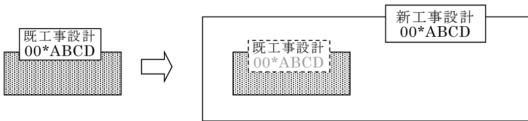
図1 「00*ABCD」は工事設計認証番号を示す

4.1.1 新工事設計が既工事設計のすべてを包含していること。包含のイメージは図1のとおり。