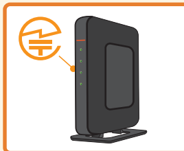
無線LAN 据え置き型の機器:裏面