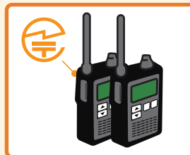
トランシーバー:裏面または内蔵バッテリーを取り外した部分