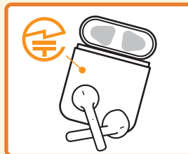
ワイヤレスイヤホン:本体や外箱など